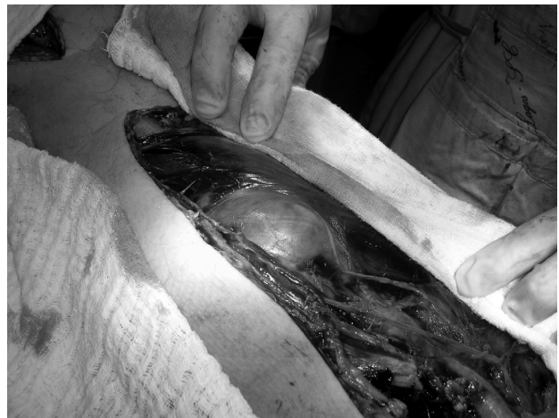
Figura 3 - Transoperatório, dissecção do saco aneurismático

No controle 30 dias após a cirurgia, o paciente não relatou qualquer queixa e deambulava sem restrições. Realizado dúplex arterial, revelou perviedade da prótese sem outros aneurismas nos membros inferiores. O paciente apresentava aneurisma da aorta abdominal suprarrenal medindo 5,76 cm no maior diâmetro. O exame do material