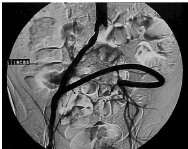
Figura 2 - Enxerto ilíaca externa direita para ilíaca interna esquerda.

A viabilidade do membro inferior frente à obstrução arterial crônica do território aorto-iliaco depende de ampla rede de colaterais para o aporte sanguíneo para a região acometida. Essa circulação